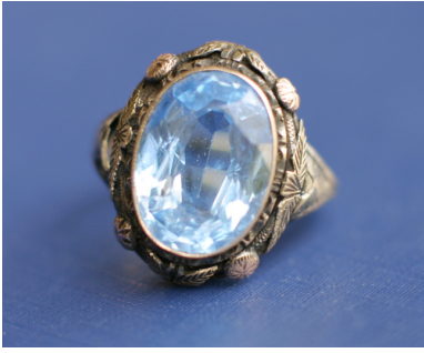
Pierścionek wydobyty podczas prac ekshumacyjnych w Bykownii