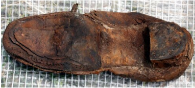
But wydobyty podczas prac ekshumacyjnych w Bykownii