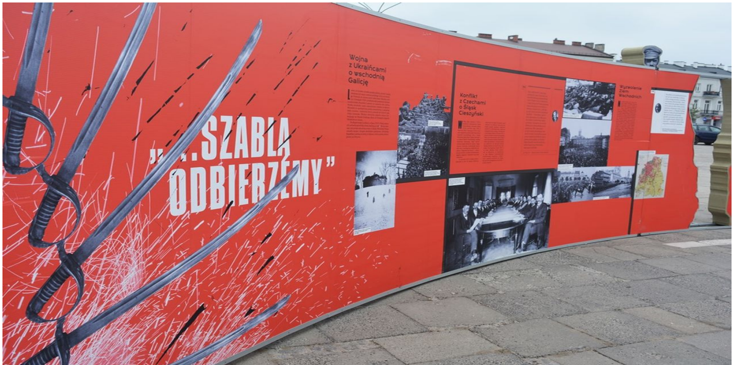
Element wystawy IPN „Powstała, by żyć”, opisujący m.in. konflikt o Śląsk Cieszyński.

https://przystanekhistoria.pl/pa2/teksty/63522,Polsko-czechoslowacki-konflikt-w-1919-r.html