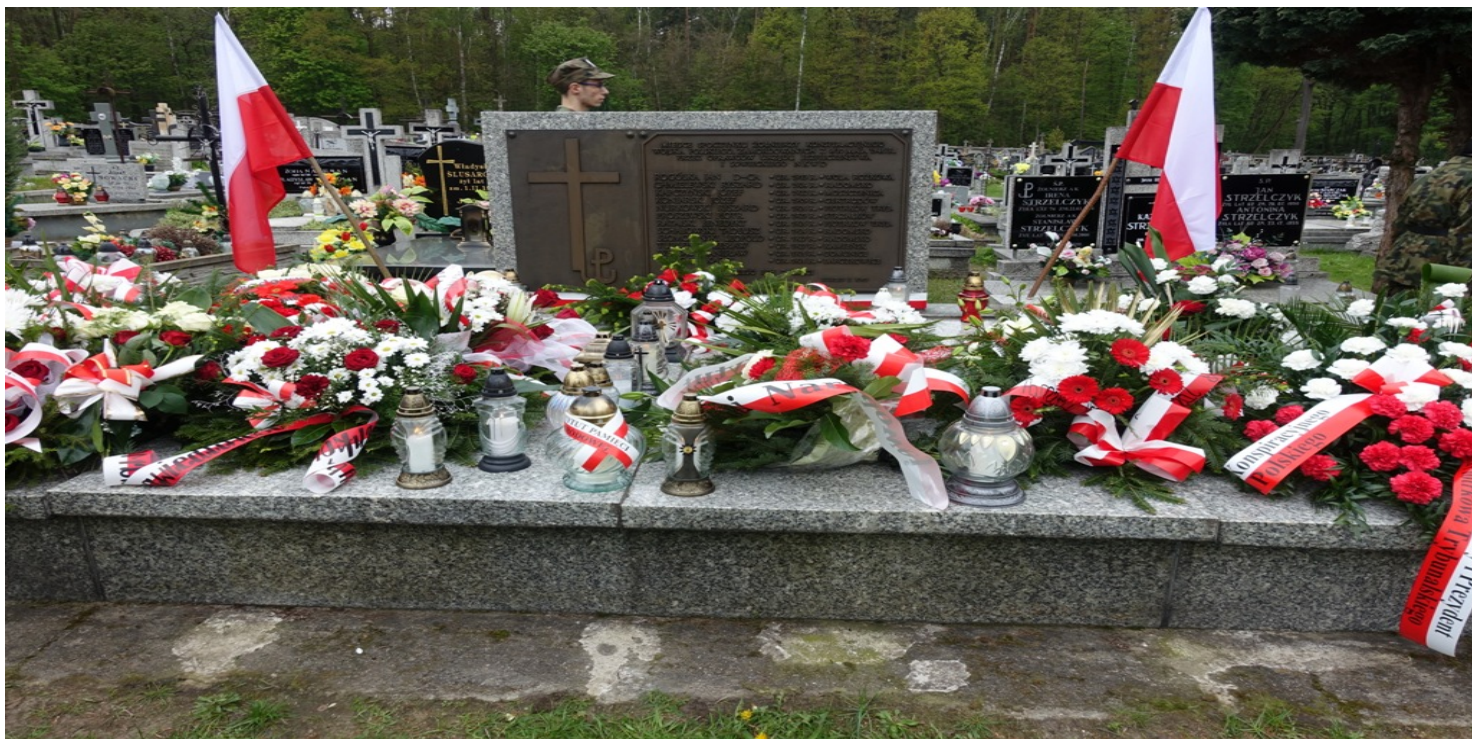
Mogiła dwunastu żołnierzy Konspiracyjnego Wojska Polskiego na cmentarzu w Bąkowej Górze, 2017 r.

https://przystanekhistoria.pl/pa2/teksty/63423,Proces-siedemnastu-w-Radomsku-7-maja-1946-r.html