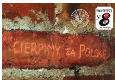
Napis wydrapany przez więźnia na ścianie celi w kamienicy przy Strzeleckiej 8