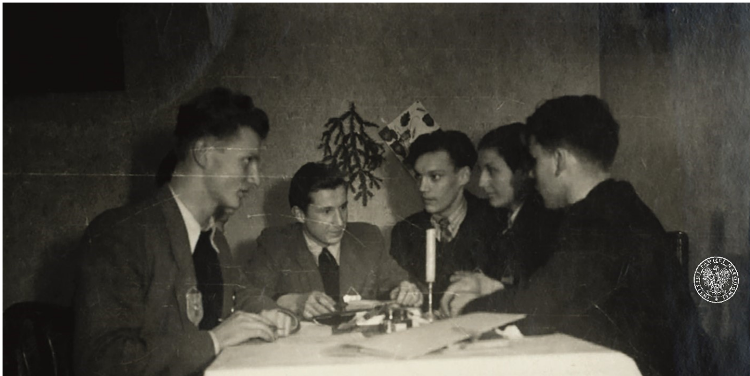
Spotkanie członków jednej z podziemnych organizacji antykomunistycznych polskiej młodzieży; 1951.

https://przystanekhistoria.pl/pa2/teksty/63228,Mlodziezowa-organizacja-antykomunistyczna-Bialy-Orzel-w-Moszczenicy-1953.html