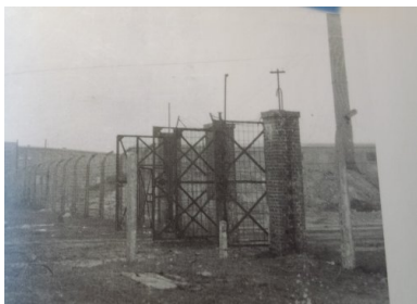
Brama wewnętrzna obozu w Jaworznie bezpośrednio po likwidacji obozu w 1956 r., Fot. Archiwum Muzeum Miasta Jaworzna.