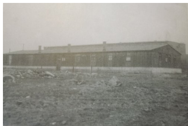
Barak warsztatów obozowych. Okres po likwidacji obozu w 1956 r.