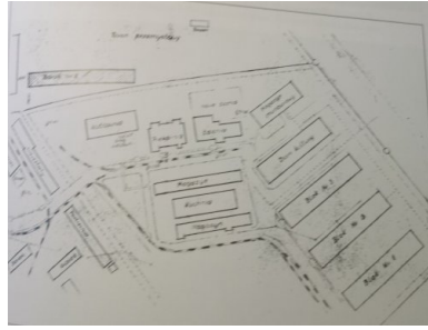
Plan Wiezienia Progresywnego dla Młodocianych Więźniów Politycznych z 1953 r. Fot. Archiwum Muzeum Miasta Jaworzna.

Zdjęcie lotnicze terenu obozu w Jaworznie z 1953 r.. Wojskowe Centrum Geograficzne w Warszawie.