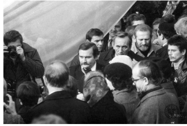
Pogrzeb zamordowanego przez komunistyczną Służbę Bezpieczeństwa ks. Jerzego Popiełuszki, Warszawa, 3 XI 1984 r. Na zdjęciu uczestniczący w pogrzebie działacze ówczesnej opozycji związanej z Solidarnością: Lech Wałęsa, Tadeusz Mazowiecki, Bronisław Geremek