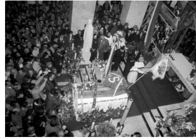
Msza św. pogrzebowa w intencji zamordowanego przez komunistyczną Służbę Bezpieczeństwa ks. Jerzego Popiełuszki, Kościół pw. św. Stanisława Kostki na warszawskim Żoliborzu, 3 XI 1984 r.

Dzięki fotografiom pierwsza strona „PWA” odróżniała się od innych pism podziemnych i z pewnością mogła przyciągać uwagę czytelnika. Również na kolejnych stronach pojawiały się zdjęcia. Wybrane przez redaktorów pisma fotografie bardzo często nawiązywały do najważniejszych bieżących wydarzeń. Przykładowo w lutym 1986 roku numer „PWA” otwierały fotografie Władysława Frasyniuka, Bogdana Lisa i Adama Michnika, których proces właśnie wtedy się odbywał. Wiele zdjęć publikowanych przez „PWA” ilustrowało artykuły na tematy zagraniczne, które były kolejnym znakiem rozpoznawczym tego tytułu. Czytelnik pisma sięgający po jeden z numerów z marca 1986 roku na pierwszej stronie zwracał uwagę przede wszystkim na fotografię przedstawiającą grupę filipińskich komandosów z karabinami w rękach. Takie zdjęcia wzbudzały ciekawość i zachęcały do lektury. Dla odbiorcy wychowanego w PRL były szczególnie interesujące, ponieważ pokazywały obrazki z egzotycznego świata: Afryki, Ameryki Południowej czy Bliskiego Wschodu.