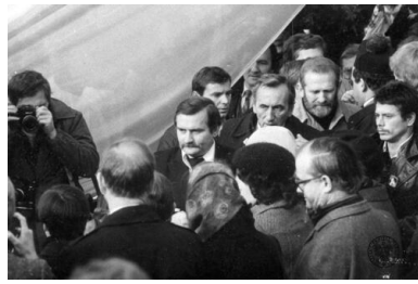
Pogrzeb zamordowanego przez komunistyczną Służbę Bezpieczeństwa ks. Jerzego Popiełuszki, Warszawa, 3 XI 1984 r. Na zdjęciu uczestniczący w pogrzebie działacze ówczesnej opozycji związanej z Solidarnością: Lech Wałęsa, Tadeusz Mazowiecki, Bronisław Geremek