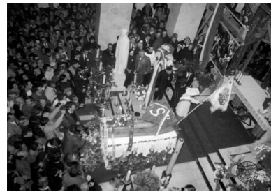
Msza św. pogrzebowa w intencji zamordowanego przez komunistyczną Służbę Bezpieczeństwa ks. Jerzego Popiełuszki, Kościół pw. św. Stanisława Kostki na warszawskim Żoliborzu, 3 XI 1984 r.

Dzięki fotografiom pierwsza strona „PWA” odróżniała się od innych pism podziemnych i z pewnością mogła przyciągać uwagę czytelnika. Również na kolejnych stronach pojawiały się zdjęcia. Wybrane przez redaktorów pisma fotografie bardzo często nawiązywały do najważniejszych bieżących wydarzeń. Przykładowo w lutym 1986 roku numer „PWA” otwierały fotografie Władysława Frasyniuka, Bogdana Lisa i Adama Michnika, których proces właśnie wtedy się odbywał. Wiele zdjęć publikowanych przez „PWA” ilustrowało artykuły na tematy zagraniczne, które były kolejnym znakiem rozpoznawczym tego tytułu. Czytelnik pisma sięgający po jeden z numerów z marca 1986 roku na pierwszej stronie zwracał uwagę przede wszystkim na fotografię przedstawiającą grupę filipińskich komandosów z karabinami w rękach. Takie zdjęcia wzbudzały ciekawość i zachęcały do lektury. Dla odbiorcy wychowanego w PRL były szczególnie interesujące, ponieważ pokazywały obrazki z egzotycznego świata: Afryki, Ameryki Południowej czy Bliskiego Wschodu.