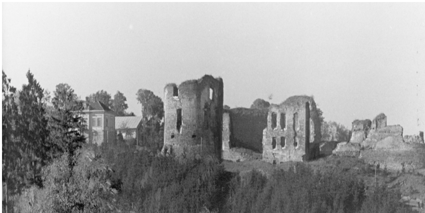
Ruiny Zamku w Buczaczu

https://przystanekhistoria.pl/pa2/teksty/62808,Okreg-AK-Tarnopol.html