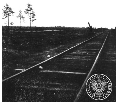
Widok na bocznice kolejowa obozu zagłady w Treblince, 7 listopada 1945 r.