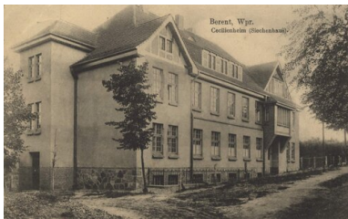
Zdjęcie wykonane w Kościerzynie przed 1914 rokiem

Polityka wojny kulturowej realizowana przez kanclerza i głównego autora zjednoczenia Niemiec w 1871 r. Ottona von Bismarcka, pojmowana w szerokim znaczeniu, wymierzona była w Kościół rzymskokatolicki w całym państwie, jako że był on jednym z nielicznych segmentów gmachu nowego Cesarstwa Niemieckiego nie wkomponowujących się w kreowane w Berlinie wizje polityczne. Szczególny przebieg konfrontacja ta przybrała na ziemiach zamieszkiwanych przez ludność polską, gdzie aspekt wyznaniowy wzmagał podział przebiegający już i tak wyraźnie w wielu innych obszarach.