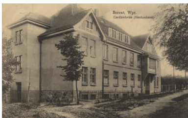
Zdjęcie wykonane w Kościerzynie przed 1914 rokiem

Polityka wojny kulturowej realizowana przez kanclerza i głównego autora zjednoczenia Niemiec w 1871 r. Ottona von Bismarcka, pojmowana w szerokim znaczeniu, wymierzona była w Kościół rzymskokatolicki w całym państwie, jako że był on jednym z nielicznych segmentów gmachu nowego Cesarstwa Niemieckiego nie wkomponowujących się w kreowane w Berlinie wizje polityczne. Szczególny przebieg konfrontacja ta przybrała na ziemiach zamieszkiwanych przez ludność polską, gdzie aspekt wyznaniowy wzmagał podział przebiegający już i tak wyraźnie w wielu innych obszarach.