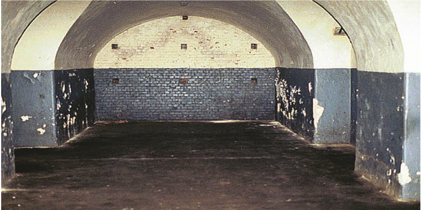
Cela w Fortcie VII, widok obecny.

https://przystanekhistoria.pl/pa2/teksty/61353,Wieziennno-obozowe-wspomnienia-Wandy-Serwanskiej.html