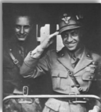
Ks. Carlo Gnocchi z generałem Luigim Reverberim przy wyjeździe na front rosyjski, 1942

A zarazem ta książka to przede wszystkim wstrząsający zapis Golgoty jego rodaków wysłanych przez Benito Mussoliniego na bezdroża „nie ludzkiej ziemi” celem wzięcia udziału w budowaniu u boku III Rzeszy nowego porządku politycznego na Starym Kontynencie. Zapiski Błogosławionego ujawniają niewyobrażalne cierpienia zwykłych żołnierzy, które kapłan porównuje z męką Chrystusa na Krzyżu. To pochwała wpisanych w naturalny cykl przyrody praktyk religijnych ludzi gór, znanych nam dobrze z nauczania św. Jana Pawła II podczas pielgrzymek na Podhale.