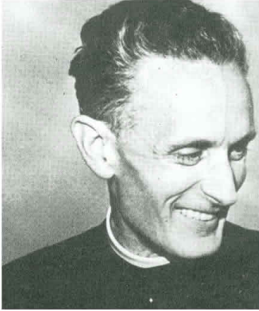
Ks. Carlo Gnocchi (1902-1956)