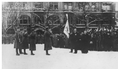
Poznań (obecny plac Wolności), 26 stycznia 1919 r. przysięga Wojsk Wielkopolskich. Gen. Józef Dowbor-Muśnicki przy sztandarze przedstawiciele Naczelnej Rady Ludowej Wojciech Korfanty i ks. Stanisław Adamski.

marszałka Ferdynanda Focha. Strona niemiecka, zagrożona wznowieniem działań wojennych na zachodzie, oddała wówczas pole i 16 lutego 1919 r. i zgodziła się na podpisanie dokumentu przedłużającego rozejm z Compiègne na czas nieokreślony oraz uzupełnienie jego treści o kluczowy dla walczącej Wielkopolski akapit, w myśl którego Niemcy miały „zaniechać niezwłocznie wszelkich kroków przeciwko Polakom w Poznańskim”. Niemieckie siły otrzymały zakaz przekraczania linii demarkacyjnej wytyczonej wzdłuż frontu niemiecko-wielkopolskiego. Oznaczało to w istocie formalne uznanie przez mocarstwa zachodnie wyniku powstania wielkopolskiego, wyłączenie Poznańskiego spod niemieckiego zwierzchnictwa, a także otwierało drogę do tak wyczekiwanej przez wszystkich Poznańczyków wolnej Polski.