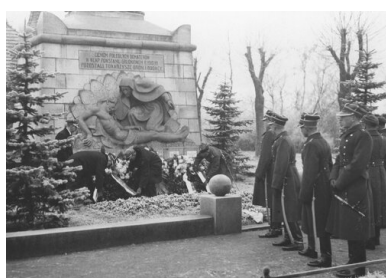
Składanie rocznicowych wieńców u stóp pomnika Powstańców Wielkopolskich na poznańskim Górczynie, XII 1932 r. Na grobowcu z 1924 r. nad przestawieniem Matki Bożej pochylającej się nad ciałem