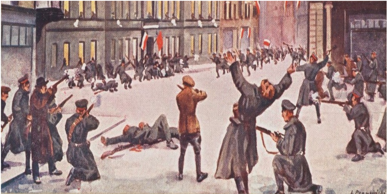
L. Prauziński, Szturm powstańców na budynek Prezydium Policji 27 XII 1918 r. Pocztówka ze zb. Biblioteki Narodowej

https://przystanekhistoria.pl/pa2/teksty/61077,Grudniowa-wiktoria.html