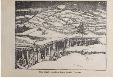
Ilustracja z książki Boje legionistów polskich. Bitwa pod Łowczówkiem, Piotrków 1916.

I wtedy okazuje się, że wcześniejszy rozkaz jest pomyłką sztabu Pattaya. Polacy wracają, ale ich okopy są już zajęte przez Rosjan. W twarz dostają karabinowe salwy. A więc bagnety na broń i szturm. Nieprzyjaciel wyparty. Znowu zajmują umocnienia na wzgórzu 360, pozycje które dają strategiczną przewagę. Rosjanie usuwają się gdzieś w pobliże. Zapada ciemność. Walka dogasa. Następuje jakieś nieformalne zawieszenie broni. Wtedy właśnie dochodzi do sytuacji niezwyklej.