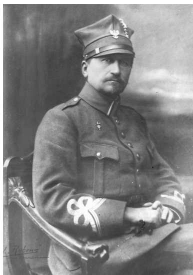
Józef Dowbor-Muśnicki