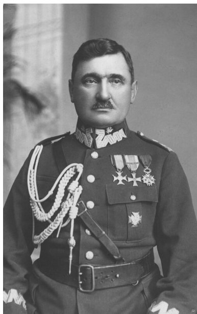
Stanisław Taczak.

i tablic pamiątkowych; nieliczne ocalały, przechowywane przez Polaków pod groźbą aresztowania. W okresie stalinizmu bezpieka próbowała wikłać weteranów w sprawy dywersyjno-polityczne (m.in. w Bydgoskiem), ale spęzło to na niczym.