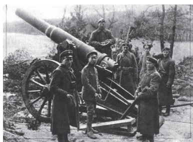
Działo „Barbara” z baterii artylerii ciężkiej na stanowisku pod wsią Zatom Stary k. Międzychodu, luty 1919 r.