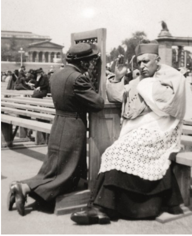
József Mindszenty spowiada podczas Kongresu Eucharystycznego w 1938 r.