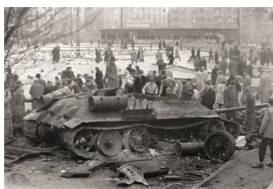
Unieruchomiony czołg sowiecki w Budapeszcie, 1956 r.

W 1951 r. na bezpośrednie polecenie sekretarza generalnego Węgierskiej Partii Pracujących Mátyása Rákosiego (właśc. Rosenfelda) wysadzono w Budapeszcie kościół Regnum Marianum. Postawiono tam później pomnik Józefa Stalina, który z kolei został zniszczony przez antykomunistycznych demonstrantów podczas powstania budapeszteńskiego w 1956 r.