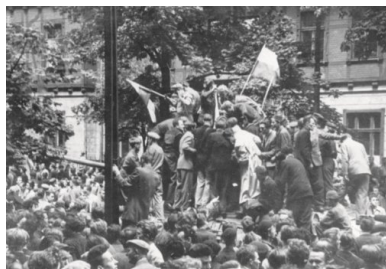
Poznański Czerwiec '56. Fot.

z Polską represje wobec duchowieństwa były znacznie brutalniejsze i krwawsze – w dodatku miały one swoją drugą fazę (po pierwszej, „stalinowskiej”), która nastąpiła po zdławieniu powstania w 1956 r.