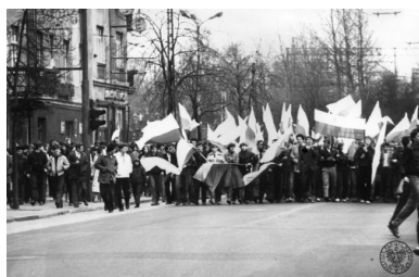
Czoło manifestacji idącej w dniu 1 maja 1982 r. w Gdyni (prawdopodobnie na ul. 10 lutego).