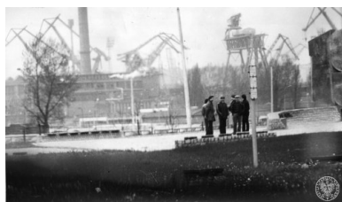
Plac przy pomniku Grudnia 1970 w Gdyni (po prawej stronie widoczny jest fragment pomnika). W tle zabudowania żurawie w stoczni im. Komuny Paryskiej, 1 maja 1982 r.