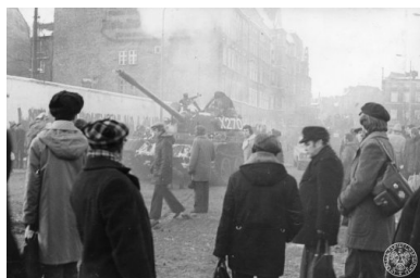
Ulice Gdańska w grudniu 1981 r.