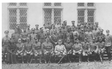
Dowódcy oddziałów I Korpusu Polskiego z generałem Józefem Dowborem-Muśnickim (siedzi 6. z lewej), Bobrujsk 1917 r.

A Maria Dąbrowska w swoich Dziennikach, choć nieco bardziej sceptyczna wobec informacji o sukcesach polskich wojsk na Wschodzie, również dawała upust swemu zachwytowi dla gen. Dowbora: „To, co robi Dowbór-Muśnicki, to jakby baśń historii”.