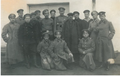
Generał Dowbor-Musnicki w otoczeniu delegatów Rad Robotniczych i Żołnierskich w sztabie I Armii Rosyjskiej w 1917 r.