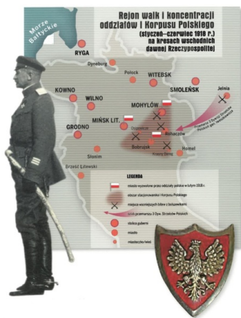
Patriotyczna wpinka z orłem noszona na mundurze przez gen. Dowbora oraz żołnierzy i oficerów I Korpusu Polskiego.

Z bazą w Bobrujsku można było teraz odeprzeć napierające siły bolszewickie. Doszło do ciężkich walk pod Rohaczowem i Żłobinem, skąd słabsze siły polskie musiały się przejściowo wycofać pod naporem nieprzyjaciela. Pod Toszczycą oddział Legii Rycerskiej (złożony z oficerów, dla których zabrakło stanowisk) po kilkudniowym boju powstrzymał napór oddziałów czerwonych marynarzy i strzelców łotewskich, zadając im duże straty. Z kolei pod Mińskiem 19 lutego 1918 r. Polacy zdobyli po ciężkich walkach strategicznie położoną stację Osipowicze.