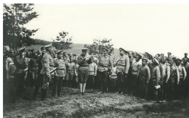
Aleksander Kiereński przed frontem XXXVIII Korpusu Armijnego w obecności gen. Józefa Dowbora-Muśnickiego i gen. Antona Denikina, 1917 r.

Mimo niezliczonych przeszkód kolejne oddziały polskie docierały stopniowo na miejsce koncentracji, ponosząc jednak duże straty. Odbywało się to bowiem w trudnych zimowych warunkach i wśród ciągłych walk z bolszewikami. W tym czasie liczebność korpusu spadła do ok. 12 tys. ludzi. Jednak nieprzyjacielowi nie udało się rozbić polskich jednostek, których morale okazało się nie do złamania. Stopniowo formował się front polsko-bolszewicki. 1. Dywizja Strzelców Polskich zajęła pozycje pod Rohaczowem, 2. Dywizja między Rohaczowem a Bobrujskiem, a 3. Dywizja znajdowała się w marszu z Jelni pod Smoleńskiem i dotarła do głównych sił kilka tygodni później, 3 marca 1918 r. W Dukorze pod Mińskiem stacjonował 1. Pułk Ułanów, który zabezpieczał teren koncentracji od zachodu.