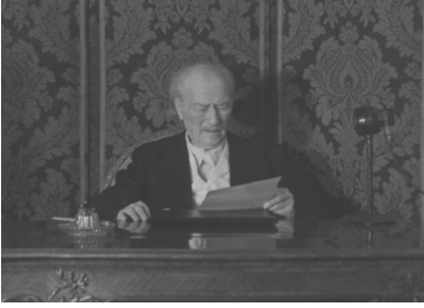
Ignacy Jan Paderewski przed mikrofonem radiowym w Chicago podczas tournée po Stanach Zjednoczonych, marzec 1923 r.