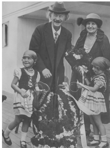
Ignacy Jan Paderewski z żoną Heleną w towarzystwie dziewczynek w strojach