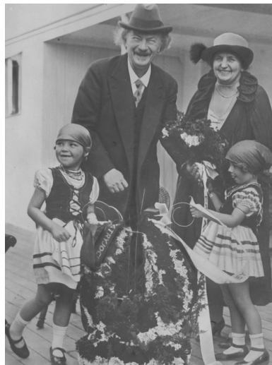
Ignacy Jan Paderewski z żoną Heleną w towarzystwie dziewczynek w strojach