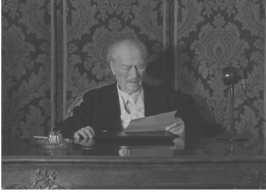
Ignacy Jan Paderewski przed mikrofonem radiowym w Chicago podczas tournée po Stanach Zjednoczonych, marzec 1923 r.