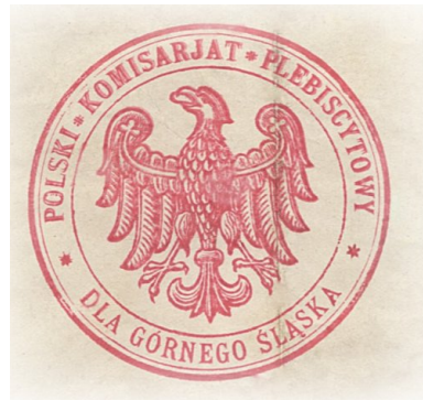
Pieczęć Polskiego Komisariatu Plebiscytowego