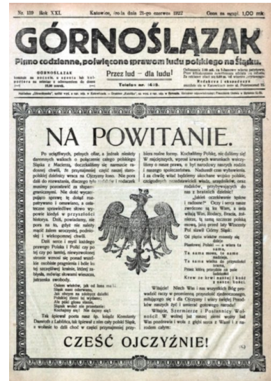
Strona tytułowa „Górnoślązaka” z informacją o wkroczeniu wojsk polskich do części Górnego Śląska, przejętej przez władze polskie, 21 czerwca 1922 r.