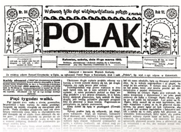
Strona tytułowa pisma „Polak”, wydawanego i redagowanego przez Wojciecha Korfantego przed I wojną światową.

I oto Korfanty stał się redaktorem z zagwarantowaną swobodą głoszenia własnych poglądów, ale przecież podległym swemu niedawnemu przeciwnikowi, od niego pobierającym pensję. Napieralski mógł się go w każdej chwili pozbyć – co też zresztą w 1912 r. uczynił. Zanim do tego jednak doszło, pozycja polityczna Korfantego uległa daleko idącej zmianie. Można wręcz mówić o ideowej wolcie polityka z Siemianowic Śląskich.