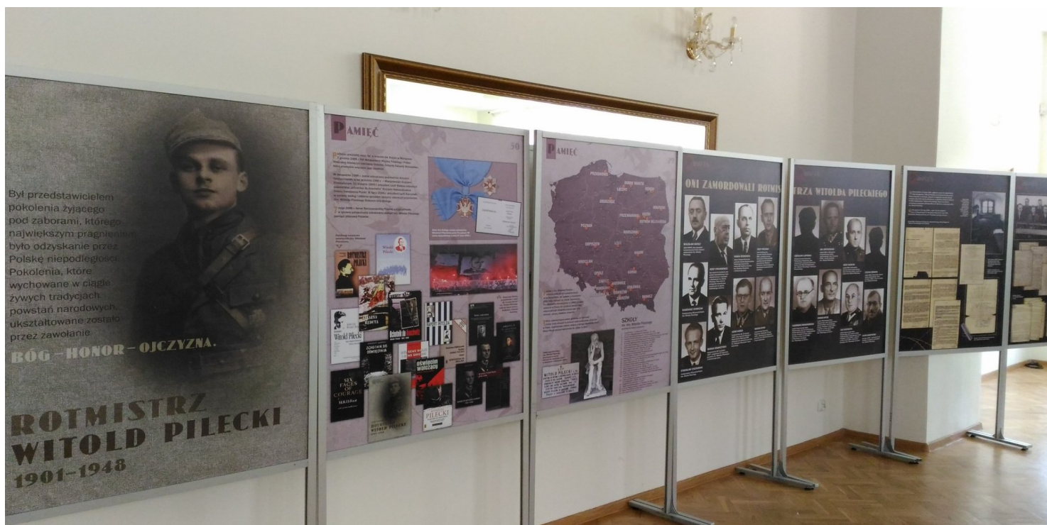
Prezentacja wystawy „Rotmistrz Witold Pilecki 1901-1948”

https://przystanekhistoria.pl/pa2/teksty/54858,Witold-Pilecki-Bohater-1939-1945.html