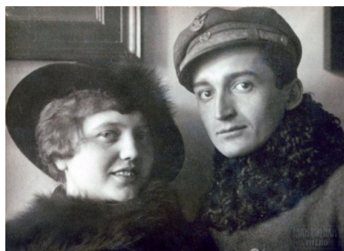
Zdjęcie ślubne Janiny i Augusta Emila Fieldorfów, Wilno, 1919 r.

Emil Fieldorf „Nil”, skazany na śmierć 16 kwietnia 1952 r., spędził w więzieniu przed egzekucją dziewięć miesięcy. Dzień po dniu czekał na wieści o losach podania o rewizję wyroku i na postanowienie Sądu Najwyższego. W jego mokotowskiej celi więźniowie starali się dostrzec zza blindy, czy na podwórzu pojawiły się skrzynie z surowych desek. Ile ich przygotowano, tyle egzekucji zaplanowano na najbliższą noc.