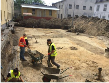
Więzienie przy ul. Rakowieckiej w Warszawie.

lipca do 5 sierpnia 2017 r. i od 25 września do 6 października 2017 r. – na terenie dawnego aresztu śledczego przy ul. Rakowieckiej w Warszawie prowadzono poszukiwania przy murze straceń, w pobliżu pawilonów „X” i „N”, gdzie odnaleziono kilka fragmentów szczątków osób zamordowanych w czasie okupacji niemieckiej i Powstania Warszawskiego oraz wiele przedmiotów osobistych ofiar. Działania poszukiwawcze zostaną wznowione w 2018 r.