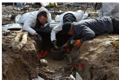
Stary Grodków.

Działaniami poszukiwawczymi zrealizowanymi w grudniu 2016 oraz lipcu i listopadzie 2017 r. objęto też kilka miejsc zlokalizowanych w pobliżu dawnego lotniska wojskowego w Starym Grodkowie, na którym w marcu i kwietniu 2016 zespół IPN odnalazł szczątki kilkudziesięciu partyzantów „Bartka” zlikwidowanych również we wrześniu 1946 r. Prace realizowano z Oddziałową Komisją Ścigania Zbrodni przeciwko Narodowi Polskiemu IPN w Katowicach oraz z udziałem saperów z 1. Pułku Saperów z Brzegu.