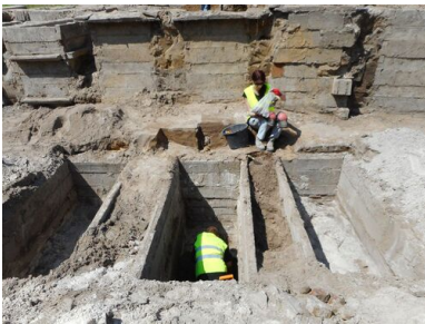
„Łączka” na Cmentarzu Wojskowym na Powązkach w Warszawie.