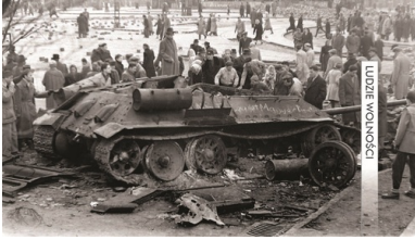
Uszkodzony czołg sowiecki w Budapeszcie, październik 1956 r.