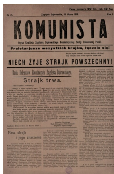
Organ Komitatu Zagłębia Dąbrowskiego Komunistycznej Partii Robotniczej Polski, 1919.