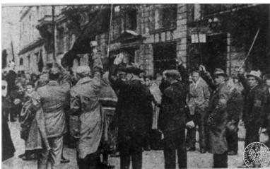
Członkowie bojówki P.P.S. próbują zatrzymać pochód komunistyczny.