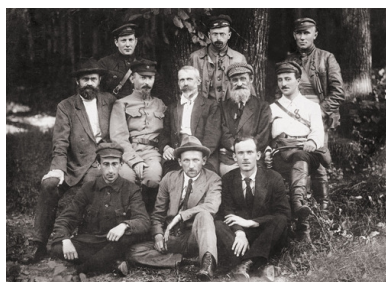
Polrewkom, początek sierpnia 1920. W środku: Feliks Dzierżyński, Julian Marchlewski, Feliks Kon.

Statut – w punktach 13 i 14 – podkreślał, że „Uchwały KW MK są obowiązujące dla wszystkich sekcji Międzynarodówki Komunistycznej i powinny być niezwłocznie wprowadzane w życie”, jak również, że „Centralne Komitety oddzielnych sekcji Międzynarodówki Komunistycznej są odpowiedzialne przed swoimi zjazdami oraz przed KW MK. Ten ma prawo uchylać i zmieniać decyzje zarówno zjazdów sekcji, jak i komitetów centralnych”. Zgodnie ze statutem KW MK zatwierdzał programy poszczególnych sekcji, miał wyłączne prawo zwoływania zwyczajnych, jak i nadzwyczajnych zjazdów kompartii, które to obowiązane były wypełniać wszystkie polecenia oraz dyrektywy władz Kominternu. Punkt 22 statutu dawał KW MK możliwość kierowania do poszczególnych sekcji swoich pełnomocników oraz instruktorów, w celach nadzoru wykonywania uchwał kongresów Kominternu, przy czym odpowiadali oni tylko i wyłącznie przed KW. Ponadto według zapisów statutowych – punkt 36 – kompartie miały być przygotowane do przejścia w każdej chwili do formuły pracy nielegalnej.