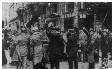
Członkowie bojówki P.P.S. próbują zatrzymać pochód komunistyczny.

21) wyrzucenie ze struktur organizacyjnych wszystkich, którzy kwestionują lub też odrzucają warunki i tezy uczestnictwa w międzynarodówce.