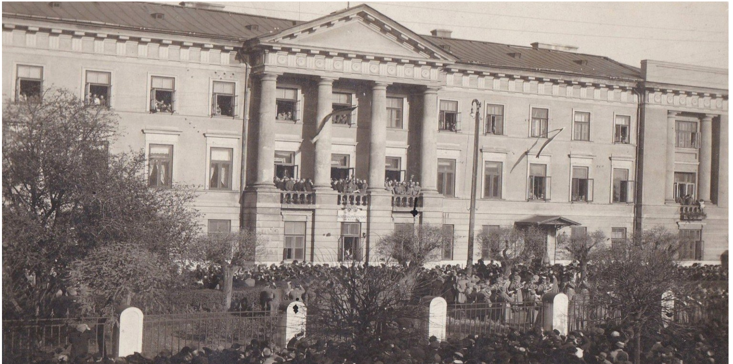
Ogłoszenie Aktu 5 listopada z balkonu Pałacu Sandomierskiego w Radomiu

https://przystanekhistoria.pl/pa2/teksty/51595,Akt-5-listopada-przelom-w-czasie-wielkiej-wojny.html