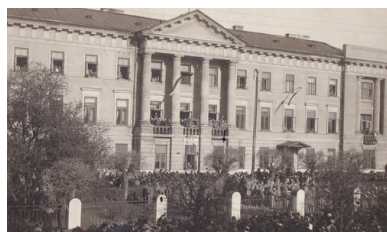
Ogłoszenie Aktu 5 listopada z balkonu Pałacu Sandomierskiego w Radomiu