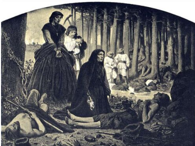
Artur Grottger, Na poboju (cykl Polonia ), 1863 r. Fot.

Wydana w 1920 r. książka Władysława Kozickiego „Sztuka polska. Zarys rozwoju polskiego malarstwa i rzeźby” reprezentuje typowe dla ówczesnej teorii kultury przekonanie, że dojrzałość kulturowa polega na spójności działań artystycznych ze świadomością narodową. Biorąc pod uwagę to, że heglowski idealizm zupełnie ignorował błędy logiczne i rzeczowe w swym systemie (na przykład takie, że pojęcie sztuki pojawiło się u samych początków istnienia ludzkości, natomiast polityczne rozumienie narodu istniało zaledwie od stu lat), łatwiej będzie zrozumieć, dlaczego Kozicki początki sztuki polskiej wyznaczył dopiero na przełom XVIII i XIX w.! Według ówczesnych teoretyków o pretendowaniu sztuki do miana rodzimej decydowała esencjonalnie rozumiana „polskość” manifestująca się w rozpoznawalnych przejawach, nie zaś kryteria obszaru geograficznego, na którym powstawała, lub mecenatu, dla którego była realizowana w ciągu wieków. Autor wspomnianej książki (zresztą nie on jeden) stawiał mocną tezę, że rozkwit sztuki polskiej przypadł na okres faktycznej utraty państwowości przez Rzeczpospolitą. Trzeba przyznać, że był to w Europie czas narodzin świadomości narodowej, która zasiła patriotyzm i dążenia niepodległościowe, a pierwsza polska uczelnia artystyczna – Akademia Sztuk Pięknych w Krakowie – powstała w roku 1818.