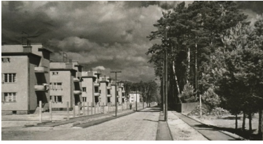
Kolonia robotnicza w Stalowej Woli.