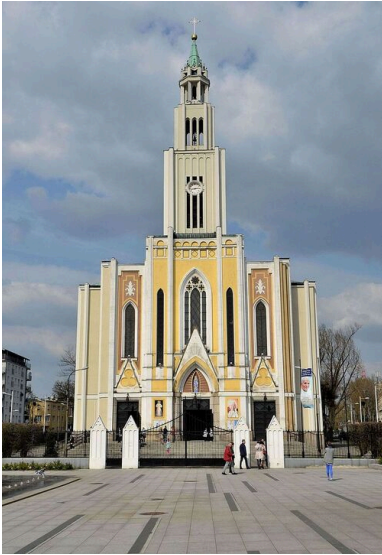
Kościół Najczystszej Serca Maryi w Warszawie.