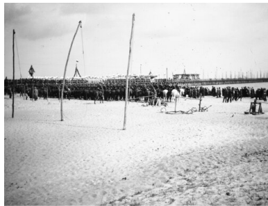
Otwarcie Tymczasowego Portu Wojennego, 27 kwietnia 1923 r.