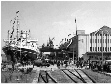
Transatlantyczny dworzec morski; przy nabrzeżu m/s „Piłsudski”, przed 1938 r.