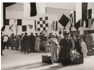
Sala odprawy celnej na Dworcu Morskim w Gdyni.

„W Dalmacji pytali mnie dziennikarze: «Jak wy to robicie, skoro my, już od pół wieku niepodlegli [...] mamy zaledwie kilka stateczków» – opowiadał swoim czytelnikom Wańkowicz – skoro Portugalczycy wyrażali mi zdumienie, że będąc trzecim imperium kolonialnym świata, przed wojną nie mieli żadnej linii własnej, a obecnie mają żalosne początki, skoro... ech, co tu gadać, skoro w Gravesund [właśc. Gravesend] polski marynarz skłął [...] angielskiego marynarza i wygodził mu nieprawdopodobnym volapükem [wolapikiem] od oferatów i niedojdów, bo źle podjechał do schodni – to już teraz wiem, że [...] wzbogacimy leksykon przekleństw tak, że się nieboszczyk [Samuel] Linde w grobie przewróci.” 12