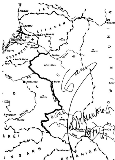
Mapa podziału Polski pomiędzy III Rzeszę a ZSRS z 28 września 1939 r. z wytyczoną granicą.