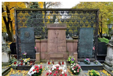
Grób Romana Dmowskiego, cmentarz Bródnowski w Warszawie.