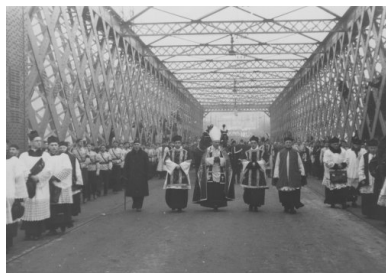
Pogrzeb Romana Dmowskiego w Warszawie w 1939 r.

państw koalicji odnotowano wiele analogicznych deklaracji oraz inicjatyw, skutkujących dalekosiężnymi konsekwencjami po wojnie. I tak, zawarte we Włoszech porozumienia między przedstawicielami południowych Słowian przesądziły o powstaniu późniejszej Jugosławii; podobnie porozumienie Czechów i Słowaków (Pittsburgh, maj 1918 r.) poprzedziło proklamowanie Czechosłowacji. Deklaracja wersalska stanowiła ważny etap na drodze materializacji politycznych wizji Dmowskiego, zapowiedź utworzenia późniejszej II Rzeczypospolitej. Jej ogłoszenie było związane ściśle z działaniami Dmowskiego na rzecz przyznania Polsce statusu alianta państw zachodnich. Ostateczny sukces tych działań stanowił kolejną, historyczną zasługę Dmowskiego.