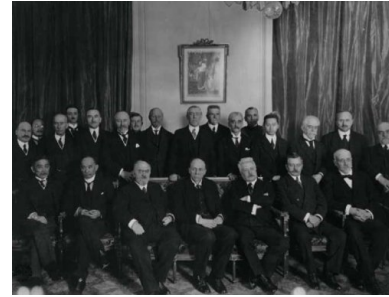
Roman Dmowski (stoi piąty od lewej) na konferencji wersalskiej, 1919 r.

W początkach XX stulecia dawna Rzeczpospolita była tylko wspomnieniem. Na jej wschodnich terenach Polacy stanowili mniejszość, niepewną swojej przyszłości w coraz bardziej wrogim otoczeniu. Ich przeciwnikiem nie były jedynie władze carskie, lecz i lokalne ruchy narodowe, litewski oraz ukraiński, budujące swą siłę raczej na walce z polskością niż na przeciwstawianiu się Rosjanom. Na zachodzie, w zaborze pruskim, polskość cofała się w obliczu skutecznej akcji germanizacyjnej. Pogłębiały się różnice nawet między Polakami zamieszkującymi odrębne zabory.