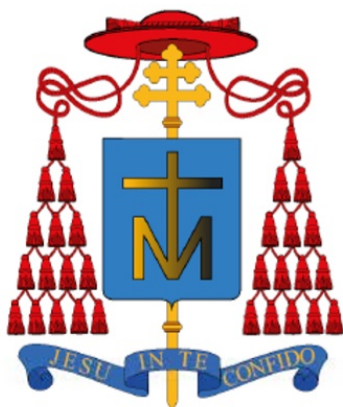
Herb kard. Franciszka Macharskiego - Jezu ufam Tobie.