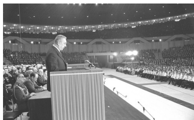
Wojewódzki wiec inaugurujący kampanię wyborczą do sejmu z udziałem I sekretarza KC PZPR Edwarda Gierka w Katowicach, 21 lutego 1972 r.

szybciej niż w innych częściach Polski można było uzyskać lokum od zakładowej spółdzielni mieszkaniowej.