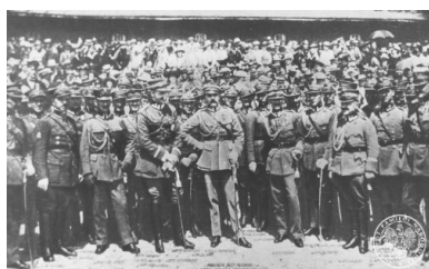
Marszałek Józef Piłsudski wśród oficerów 66. kaszubskiego pułku piechoty w Toruniu, 5 VI 1921 r.; IPN BU 024/86

Dzień 11 listopada 1918 roku został uznany za formalną datę odzyskania przez Polskę niepodległości dopiero w 1926 roku, mimo że obchodzono go już wcześniej. W okólniku wydanym 8 listopada 1926 roku przez premiera Józefa Piłsudskiego mowa jest o tym, że za trzy dni naród polski będzie obchodził „ósmą rocznicę zrzucenia jarzma niewoli”. Ten sam okólnik ustanowił 11 listopada dniem wolnym od pracy w administracji rządowej i szkolnictwie.