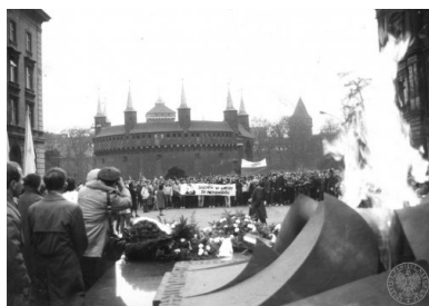
Fotografie przedstawiające uroczystości na Placu Matejki w Krakowie w dn. 11 XI 1984 r.

Inaczej było w następnych latach, po wprowadzeniu stanu wojennego i delegalizacji Solidarności. Mimo trudności opozycja antykomunistyczna przez całe lata osiemdziesiąte organizowała niezależne obchody wydarzeń z 11 listopada 1918 roku (podczas gdy władza uporczywie czciła przewrót bolszewicki w Rosji). Odprawiano nabożeństwa, składano kwiaty i wieńce w miejscach pamięci ważnych dla historii Polski (takich jak Grób Nieznanego Żołnierza w Krakowie czy pomnik Konstytucji 3 Maja w Lublinie) lub o znaczeniu lokalnym (np. kopiec-pomnik ku czci płockich harcerzy poległych w 1920 roku). Odnawiano groby legionistów, żołnierzy walczących z bolszewicką nawałą w pierwszych latach II Rzeczypospolitej czy też Żołnierzy Wyklętych. W prasie tzw. drugiego obiegu publikowano artykuły historyczne. Milicja, ZOMO i bezpieka starały się przeszkadzać społeczeństwu w świętowaniu, dość często rozpędzając patriotyczne manifestacje – tak jak to miało miejsce w Gdańsku, Katowicach czy Poznaniu w 1988 roku – lub też inwigilując ich uczestników. Tak czy inaczej, w ostatniej dekadzie istnienia PRL postać Józefa Piłsudskiego oraz data 11 listopada 1918 roku na dobre zadomowiły się w przestrzeni publicznej. O narodzinach II Rzeczypospolitej pisano nawet w oficjalnej prasie. Podobnie zresztą jak o Piłsudskim. Tyle tylko że przede wszystkim w kontekście jego działalności socjalistycznej.