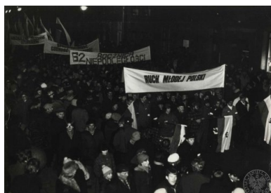
Fotografie przedstawiające manifestację w Gdańsku w dn. 11 XI 1980 r. z okazji 62. rocznicy odzyskania niepodległości, IPN Gd 536/27