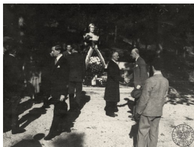
Fotografie ze zbiorów Ambasady RP w Watykanie dot. obchodów święta niepodległości w dn. 11 XI 1948 r., IPN BU 3454/307

postać pierwszego marszałka Polski funkcjonowały przede wszystkim w przestrzeni prywatnej. O postaciach i symbolach związanych z odzyskaniem przez Polaków upragnionej państwowości i narodzinach Drugiej Rzeczypospolitej mówiło się tak, jak o zdradzieckiej napaści Stalina na Polskę 17 września 1939 roku czy o zbrodni katyńskiej dokonanej w 1940 roku przez oprawców z NKWD. Zniesione Święto Niepodległości społeczeństwo polskie obchodziło przede wszystkim w kościołach, gdzie księża odprawiali nabożeństwa w intencji ojczyzny, podczas których głosili przepiękne patriotycznymi treściami kazania. Tak m.in. świętował nieformalnie wskrzeszony w Krakowie na początku lat siedemdziesiątych Związek Legionistów Polskich, najstarsza piłsudczykowska organizacja kombatancka. Rokrocznie jej członkowie organizowali 11 listopada uroczyste msze św., a następnie składali kwiaty w krypcie Józefa Piłsudskiego na Wawelu. Towarzyszył im zawsze kard. Karol Wojtyła.