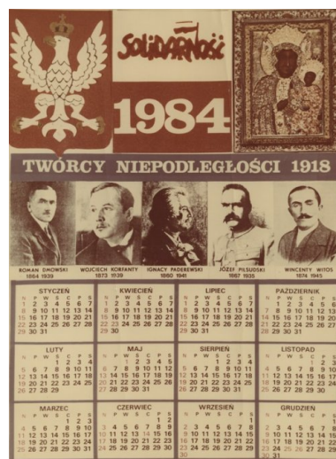
Kalendarz na 1984 rok