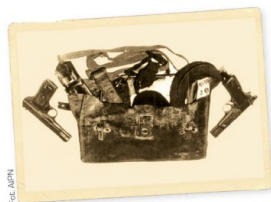
↳ Torba z uzbrojeniem znaleziona przy zabitym „Lalusiu”

Poszukiwania „Lalusia” prowadzone przez UB i SB były oznaczone kryptonimem „Pożar”. Działaniami operacyjnymi objęto jego najbliższą rodzinę i znajomych. Podejmowano próby pozyskiwania konfidentów, którzy mieli obserwować i dostarczać informacji dotyczących jego najbliższych krewnych i pomocników. W domach kilku z nich zainstalowano aparaturę podsłuchową.