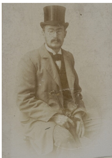
Eligiusz Niewiadomski. Fot.