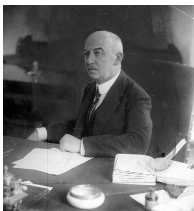
Gabriel Narutowicz.