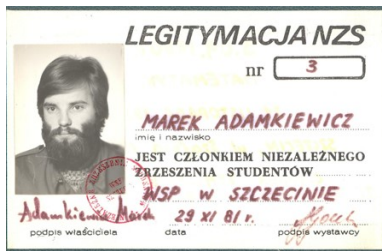
Legitymacja członkowska Nzs