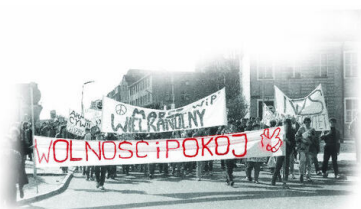
„Marsz wielkanocny”, pierwsza legalna manifestacja opozycyjna