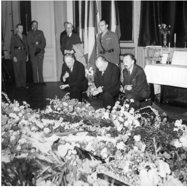
Składanie wieńców przez delegację Stronnictwa Narodowego podczas uroczystości pogrzebowych w Londynie po śmierci gen. W. Sikorskiego, lipiec 1943 r.