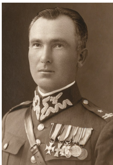
Mjr Antoni Chruściel, 1926 r.

Warto więc przypominać postać gen. „Montera”. Nie tylko dowódcy Powstania, lecz także osoby niezwykle zasłużonej dla rozwoju konspiracji w Warszawie. Człowieka, który na stałe zapisał się w dziejach Stolicy i w historii Polski.