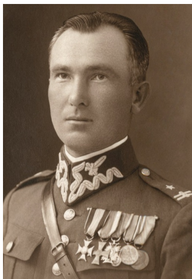
Mjr Antoni Chruściel, 1926 r.

Warto więc przypominać postać gen. „Montera”. Nie tylko dowódcy Powstania, lecz także osoby niezwykle zasłużonej dla rozwoju konspiracji w Warszawie. Człowieka, który na stałe zapisał się w dziejach Stolicy i w historii Polski.