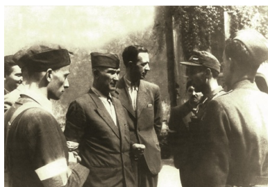
Płk Antoni Chruściel "Monter" podczas Powstania Warszawskiego, 1944 r.

Dowódca Powstania wyszedł do niewoli 5 października z oddziałami Śródmieścia Północnego. Niemcy proponowali mu przewiezienie samochodem. On jednak odmówił, nie chcąc zostawiać swoich żołnierzy. Dopiero w rejonie Dworca Zachodniego nastąpiło przymusowe oddzielenie dowódcy od podkomendnych. Wywieziono go do oflagu Langwasser, po czym przebywał w Colditz koło Lipska, skąd uwolniły go oddziały amerykańskie.