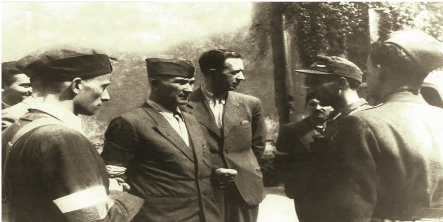
Plk Antoni Chruściel „Monter” podczas Powstania Warszawskiego, 1944 r.

https://przystanekhistoria.pl/pa2/teksty/32728,Monter-dowodca-Powstania-Warszawskiego.html