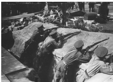
Szwoleżerowie podczas strzelania z karabinów w okopach na jednej z ulic Warszawy, maj 1926