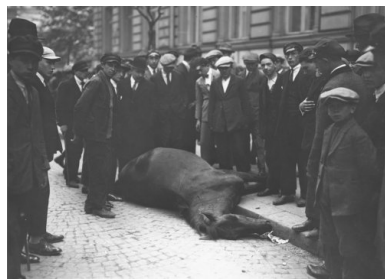
Grupa przechodniów podczas oglądania na ulicy zabitego konia, maj 1926 (NAC)