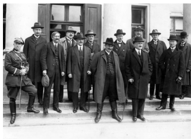
Gabinet Wincentego Witosa, 11 maja 1926 r.

Nie ulega wątpliwości, że ryzykowną rozgrywkę Piłsudski zamierzał prowadzić na gruncie czysto politycznym. Jednak posłużenie się wojskową asystą – nawet w wymiarze czysto symbolicznym – dostarczało jego przeciwnikom wyjątkowo dogodnego pretekstu, by demonstrowanemu w oparciu o armię niezadowoleni nadać znamiona wojskowego buntu. Jego zlokalizowanie zaś i szybkie stłumienie „problem Marszałka” rozwiązywałoby raz na zawsze.