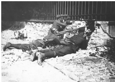
Żołnierze na stanowisku podczas obrony Belwederu. Widoczny ręczny karabin maszynowy Chauchat wz.1915., maj 1926

nadejściu pomocy z Poznania, siły rządowe przeszły do kontrnatarcia. Inicjatywę o charakterze taktycznym wojska dowodzone przez gen. Rozwadowskiego zachowały do godzin popołudniowych, ale wieczorem Marszałek był już pewien, że to on w walce o Warszawę okaże się zwycięzcą. W rękach rokoszan była już wówczas Cytadela, 71. pułk nie dotarł z odsieczą (część pododdziałów zbuntowała się), zaś posiłki dla nich napływały o wiele szybciej. Wprawdzie w stronę stolicy uparcie zdążyły z pomocą dla rządu oddziały z Krakowa i Poznania, ale już przybycie posiłków z dowodzonego przez gen. Władysława Sikorskiego DOK VI Lwów okazało się wątpliwe (część oddziałów uznano za co najmniej niepewne, zaś sam Sikorski zwlekał, zastaniając się obawami przed wystąpieniem odśrodkowych ruchów ukraińskich). W tej sytuacji decydujące walki, rozpoczęte wczesnym rankiem 14 maja, musiały przynieść definitywne rozstrzygnięcie.