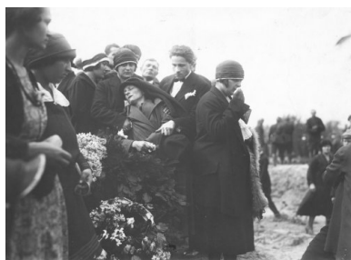
Członkowie rodziny jednej z ofiar przewrotu majowego pogrążeni w żałobie, maj 1926

Realną szansę na sforsowanie Wisły dawało jedynie przejście Trzeciego Mostu (Poniatowskiego), ale Marszałek nie chciał brać na siebie odpowiedzialności za użycie siły. Podległe mu oddziały dostały rozkaz zakazu otwierania ognia aż do chwili, gdy uczynią to żołnierze strony przeciwnej. Powściągliwość zamachowców sprawiła, że przez Trzeci Most mogła przejść Szkoła Podchorążych, wzmacniając tym samym siły rządowe, natomiast próbę jego sforsowania, podjętą przez pododdział Oficerskiej Szkoły Piechoty, powstrzymała „krótka seria w górę z ckm, ustawionego na wieżyczce mostu”. Były to pierwsze strzały, które padły 12 maja. Nie kierowano ich jednak w stronę przeciwnika. Do krwawego starcia, pierwszego podczas zamachu, doszło na Nowym Zjeździe, ogień otwarli zaś żołnierze strony rządowej.