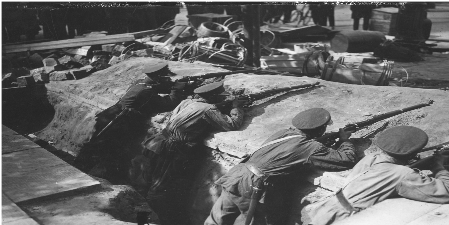
Szwoleżerowie podczas strzelania z karabinów w okopach na jednej z ulic Warszawy, maj 1926

https://przystanekhistoria.pl/pa2/teksty/32713,Przewrot-majowy-co-sie-wydarzylo-w-Warszawie-w-dniach-1215-maja-1926-r.html