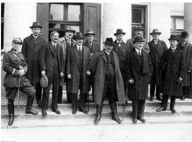
Gabinet Wincentego Witosa, 11 maja 1926 r. (NAC)

Nie ulega wątpliwości, że ryzykowną rozgrywkę Piłsudski zamierzał prowadzić na gruncie czysto politycznym. Jednak posłużenie się wojskową asystą – nawet w wymiarze czysto symbolicznym – dostarczało jego przeciwnikom wyjątkowo dogodnego pretekstu, by demonstrowanemu w oparciu o armię niezadowoleni nadać znamiona wojskowego buntu. Jego zlokalizowanie zaś i szybkie stłumienie „problem Marszałka” rozwiązywałoby raz na zawsze.