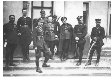
Oficerowie marszałka Józefa Piłsudskiego na schodach przed Belwederem, maj 1926