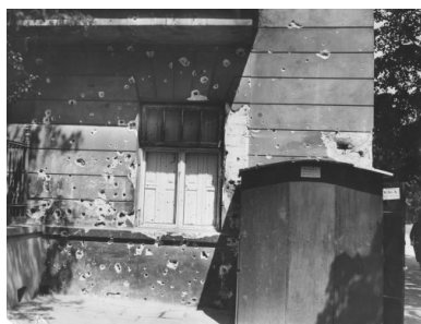
Uszkodzona ściana kamienicy przy Alejach Ujazdowskich 9. Widoczne ślady po ostrzale z karabinu maszynowego, maj 1926

Na moście Poniatowskiego Piłsudski pojawił się około 16.00, tam oczekiwał nań prezydent. Spotkanie zakończyło się fiaskiem. Wojciechowski zaproponował Piłsudskiemu powrót na drogę legalną, co oznaczało przyznanie się do porażki. Co gorsza Marszałek usłyszał, że to właśnie prezydent stoi na straży honoru armii i przekonał się naocznie, że żołnierze gotowi są wymierzyć broń w niego samego. Skoro zaś Piłsudski kapitulować nie zamierzał, pozostawała mu już tylko orężna walka.