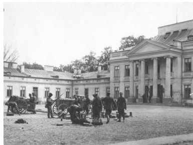
Grupa żołnierzy marszałka Józefa Piłsudskiego na placu przed Belwederem, maj 1926