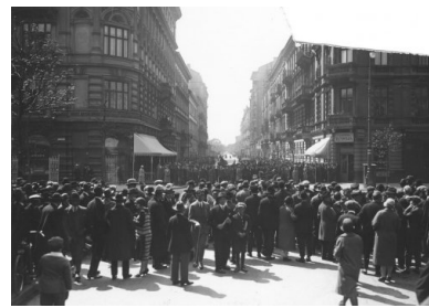
Tłum ludzi przyglądający się posterunkom wojskowym na rogu ulicy Marszałkowskiej i Nowogrodzkiej, maj 1926