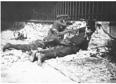
Żołnierze na stanowisku podczas obrony Belwederu. Widoczny ręczny karabin maszynowy Chauchat wz.1915., maj 1926

nadejściu pomocy z Poznania, siły rządowe przeszły do kontrnatarcia. Inicjatywę o charakterze taktycznym wojska dowodzone przez gen. Rozwadowskiego zachowały do godzin popołudniowych, ale wieczorem Marszałek był już pewien, że to on w walce o Warszawę okaże się zwycięzcą. W rękach rokoszan była już wówczas Cytadela, 71. pułk nie dotarł z odsieczą (część pododdziałów zbuntowała się), zaś posiłki dla nich napływały o wiele szybciej. Wprawdzie w stronę stolicy uparcie zdążyły z pomocą dla rządu oddziały z Krakowa i Poznania, ale już przybycie posiłków z dowodzonego przez gen. Władysława Sikorskiego DOK VI Lwów okazało się wątpliwe (część oddziałów uznano za co najmniej niepewne, zaś sam Sikorski zwlekał, zastaniając się obawami przed wystąpieniem odśrodkowych ruchów ukraińskich). W tej sytuacji decydujące walki, rozpoczęte wczesnym rankiem 14 maja, musiały przynieść definitywne rozstrzygnięcie.