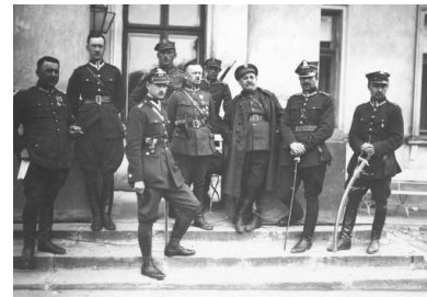
Oficerowie marszałka Józefa Piłsudskiego na schodach przed Belwederem, maj 1926