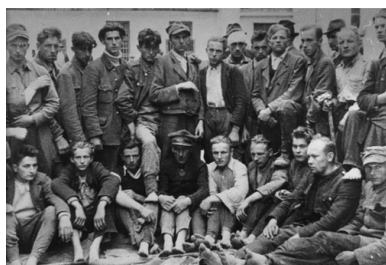
Pobici, rozbrojeni i pozbawieni butów polscy milicjanci po powrocie do Nowego Targu z odbitego przez Słowaków Podwilka

Zbrojny opór grup słowackich zakończył się wraz z wkroczeniem na sporne tereny żołnierzy 32. pp „ludowego” Wojska Polskiego, zabezpieczono wtedy granicę. Żołnierze wkroczyli na Spisz 17 lipca. Ponieważ wojsko przyszło przed milicjantami, uniknięto „powtórek” z Podwilka. Później polscy żołnierze zajęli północną Orawę. Na nowo zostały obsadzone posterunki MO. Wprowadzono polską administrację, wysiedlono słowackich nauczycieli. Nadal jednak dochodziło do antypolskich incydentów - np. w sierpniu w Krempachach na Spiszu zerwano z budynku szkoły polską flagę i godło, a na wieży kościelnej zawieszono flagę słowacką 14 . Wielu Słowaków wierzyło, że tereny te wrócą jeszcze do CSRS. W spiskich wioskach rozrzucano jesienią ulotki o wiecu planowanym w leżącej po stronie słowackiej Spiskiej Starej Wsi, podczas którego, oprócz świętowania rocznicy utworzenia Legionu Czechosłowackiego, planowano manifestację na rzecz przyłączenia całego Spiszu do CSRS 15 .