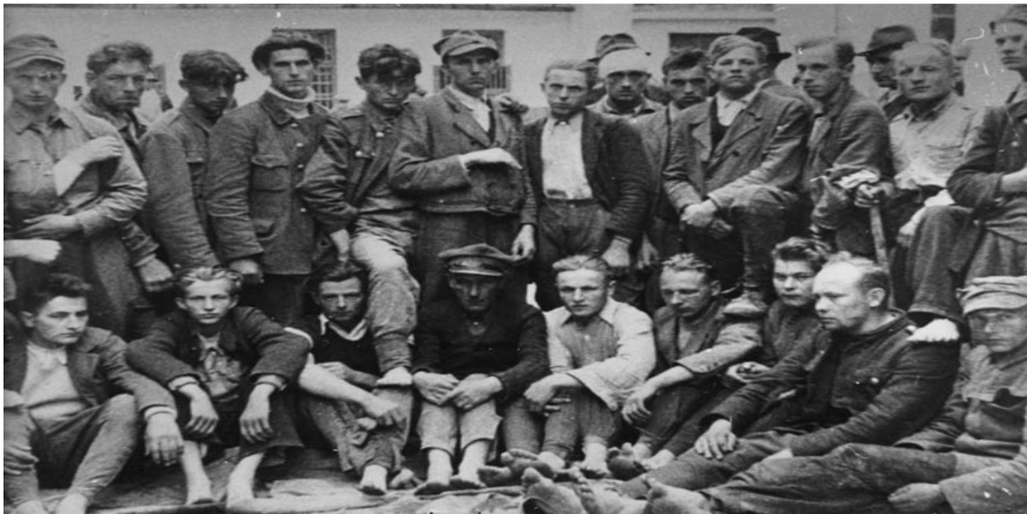
Pobici, rozbrojeni i pozbawieni butów polscy milicjanci po powrocie do Nowego Targu z odbitego przez Słowaków Podwilka (AIPN)

https://przystanekhistoria.pl/pa2/teksty/29329,Na-flankach-Podhala-Trudny-powrot-Spiszu-i-Orawy-do-Polski-po-II-wojnie-swiatowe.html