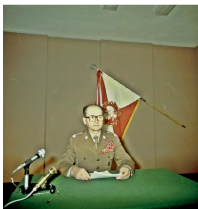
Wojciech Jaruzelski przygotowujący się do odczytania przemówienia informującego o wprowadzeniu stanu wojennego - Warszawa, 13 XII 1981 r.