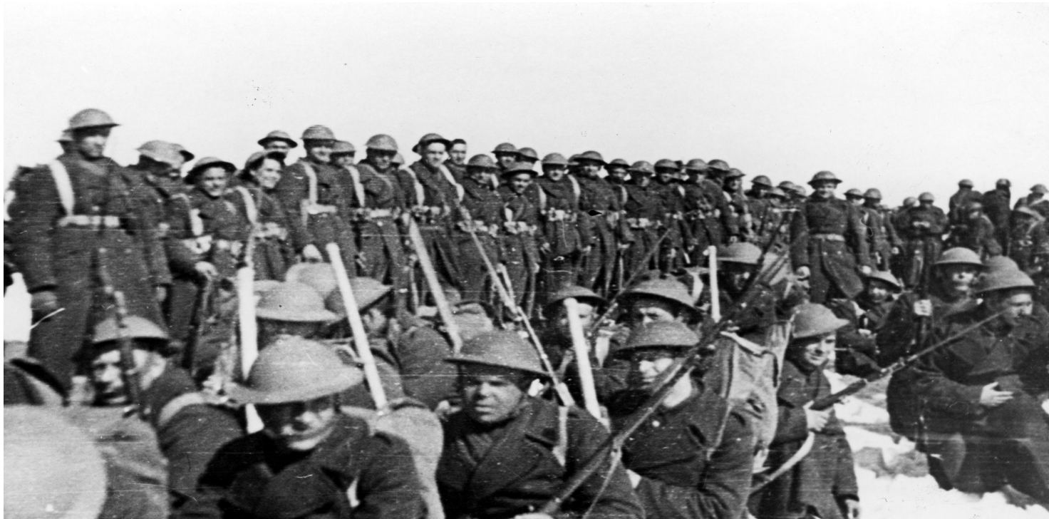
Żołnierza Armii Polskiej w ZSRS podczas ćwiczeń - 1941 r.

https://przystanekhistoria.pl/pa2/teksty/23539,Zaskakujaca-inicjatywa-O-ewakuacji-Armii-Andersa-z-Sowietow-do-Iranu-polemicznie.html