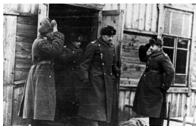
Gen. Władysław Anders dokonuje inspekcji oddziałów Armii Polskiej w ZSRS

Jak z powyższego wynika, przyczyny ewakuacji wojsk polskich z Rosji w 1942 r. miały wyłącznie charakter militarny. W źródłach z epoki brak politycznej motywacji tego wydarzenia. Motywacja tego typu to zjawisko późniejsze, oderwane od realiów historycznych lata 1942 r.