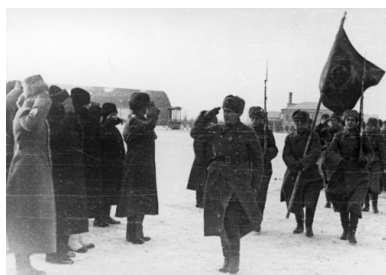
Wizyta Naczelnego Wodza gen. Władysława Sikorskiego w Armii Polskiej w ZSRS - 30 listopada 1941 r.

Pisząc o wspomnianej wyżej prośbie brytyjskiego premiera trzeba mocno podkreślić, że Churchill działał tu nie wbrew interesom rządu polskiego, ale w zgodzie z nimi. Władze brytyjskie bowiem, tak samo jak rząd RP, chciały budować nowe polskie formacje na terenie Iranu z tych Polaków, dla których – wskutek decyzji Stalina z marca 1942 r. ograniczającej liczebność oddziałów polskich do 44 tys. żołnierzy – zabrakło miejsca w szeregach Armii Polskiej w Sowietach. Jak widać nie ma żadnych rzeczowych podstaw do snucia spiskowych teorii, w których „perfidny Albion” i stalinowska Rosja wiosną 1942 r. w Londynie zdecydowały o losie wojsk polskich w Rosji z naruszeniem suwerennych praw rządu polskiego.