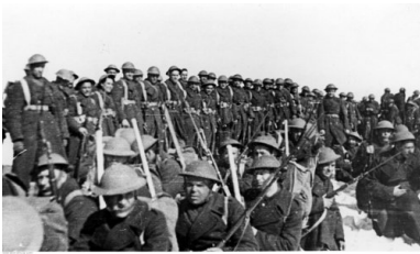
Żołnierza Armii Polskiej w ZSRS podczas ćwiczeń - 1941 r.

Inicjatorem wyprowadzenia Armii Polskiej w ZSRS do Iranu był jej dowódca – gen. Władysław Anders. Jego motywacja była złożona. Po wspomnianej, marcowej decyzji Stalina ograniczającej liczebność armii stracił on wiarę w powstanie w ZSRS wielkiej armii polskiej (pierwotnie miała ona liczyć 100 tys. żołnierzy), a ponadto chciał przenieść wojsko polskie z Rosji do Iranu, bo spodziewał się tam potężnego uderzenia niemieckiego w kierunku Indii i południowo-wschodniej Azji. Chociaż Naczelnny Wódz, gen. Władysław Sikorski, odrzucił te plany, Anders się tym nie zraził i na początku czerwca 1942 r z propozycją ewakuacji zwrócił się bezpośrednio do Stalina, zaznaczając, że sprawę tę można i należy załatwić na miejscu – bez angażowania polskiego rządu. Liczył przy tym na natychmiastową decyzję, tymczasem minął cały czerwiec, a Stalin milczał. Zareagował dopiero 30 czerwca, proponując Churchillowi przekazanie Wielkiej Brytanii armii polskiej w Rosji.