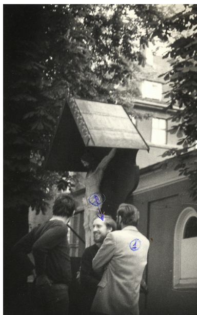
Służba Bezpieczeństwa pilnie śledziła osoby goszczące u o.