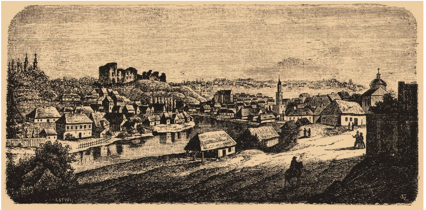
Buczacz na litografii z XIX wieku

https://przystanekhistoria.pl/pa2/teksty/22534,Buczacz-polsko-zydowskie-dziedzictwo-1.html