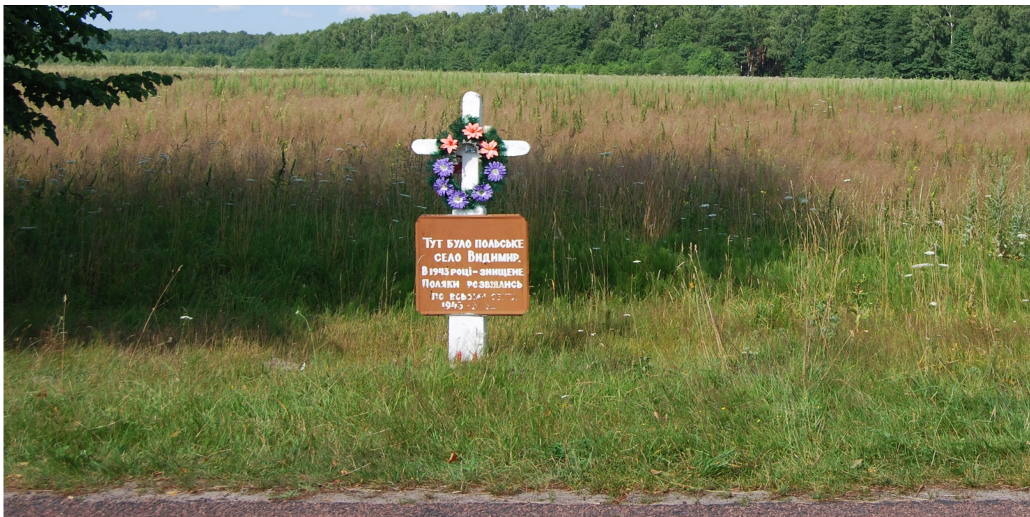
Krzyż na polu, gdzie była wieś Wydymer. Napis na krzyżu, który postawił miejscowy Ukrainiec: „Tu była polska wieś Wydymer. W 1943 roku - zniszczona. Polacy rozproszyli się po całym świecie. 1943–2006”.

https://przystanekhistoria.pl/pa2/teksty/126889,Losy-wolynskiej-kolonii-Wydymer-w-1943-roku.html