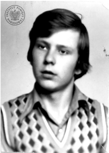
Artur Hajzer, b.d. Zdjęcie z akt paszportowych

W połowie lat osiemdziesiątych regularnie zaczął wyjeżdżać w Himalaje i Karakorum. W tym czasie odnosił też największe sukcesy, a jego partnerem wspinaczkowym został Jerzy Kukuczka: w 1986 r. nową drogą zdobyli Manaslu (8156 m), w 1987 r. zrealizowali pierwsze zimowe wejście na Annapurnę (8091 m) oraz nową drogą na Sziszapangmę (8027 m), a w 1988 r. wspięli się nową drogą na Annapurnę Wschodnią (8010 m).