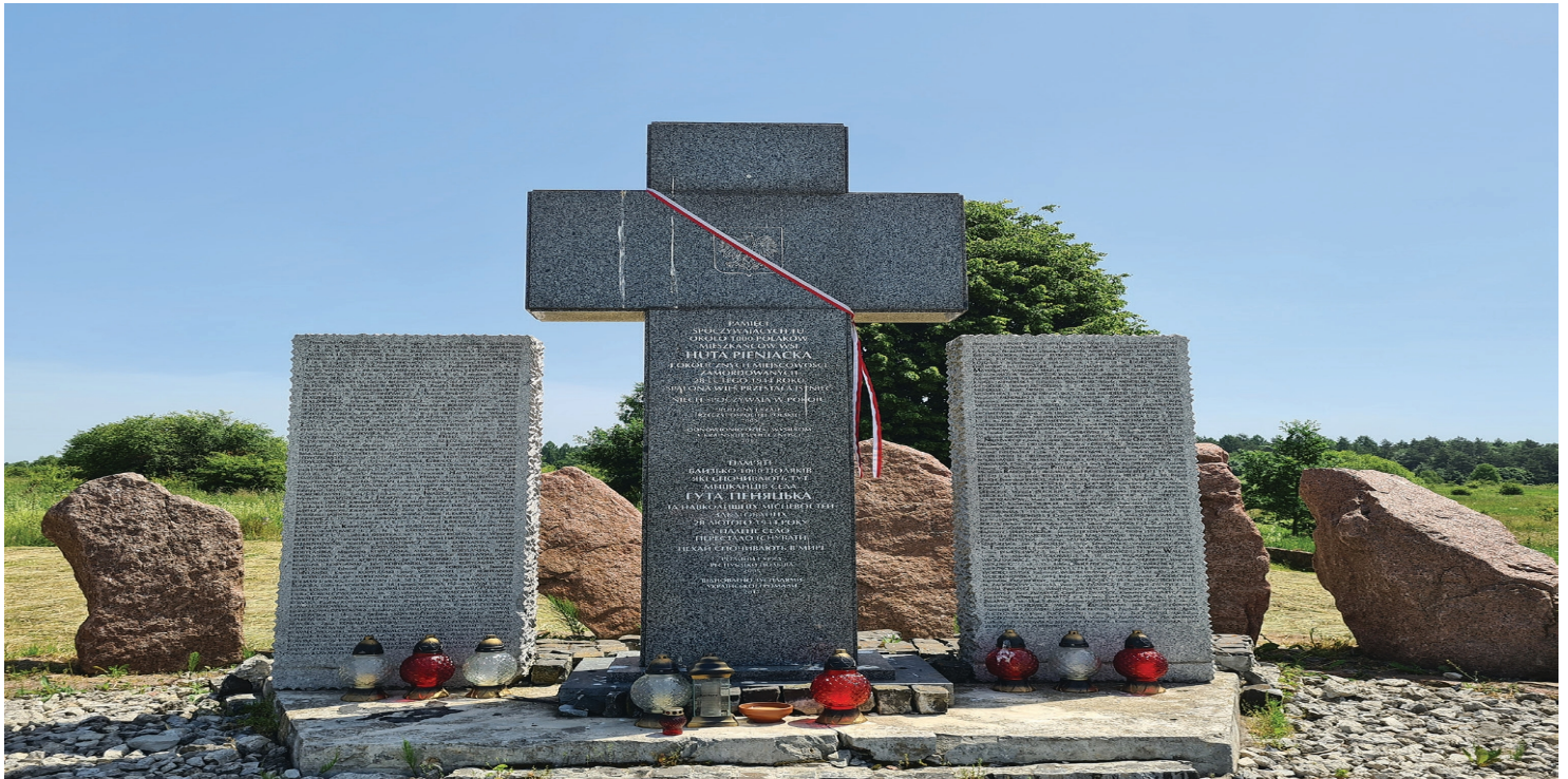
Pomnik w Hucie Pieniackiej

https://przystanekhistoria.pl/pa2/teksty/126502,Zbrodnia-wolynska-i-archeologia.html