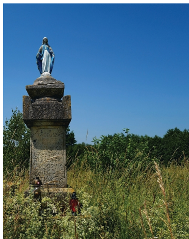
Ocalała figura Matki Boskiej na cmentarzu w Hucie Pieniackiej

Kiedy na tereny II Rzeczypospolitej wkroczyła Armia Czerwona, wielu Polaków zaczęło wstępować do „istriebitielnych batalionów”. Dowodzone przez funkcjonariuszy operacyjnych NKWD, brały one udział w akcjach przeciwko UPA (również w obronie przed napadem) oraz w pacyfikacjach wsi. Zdania na temat liczby Polaków zamordowanych na terenach Małopolski Wschodniej są różne: od 30 tys. (Damian Markowski) do 70 tys. (Ewa Siemaszko).