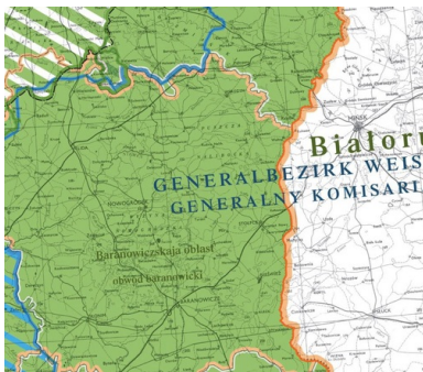
Fragm. mapy ściennej „Polska 1939-1945 - podziały administracyjne” (wyd. IPN, 2013)