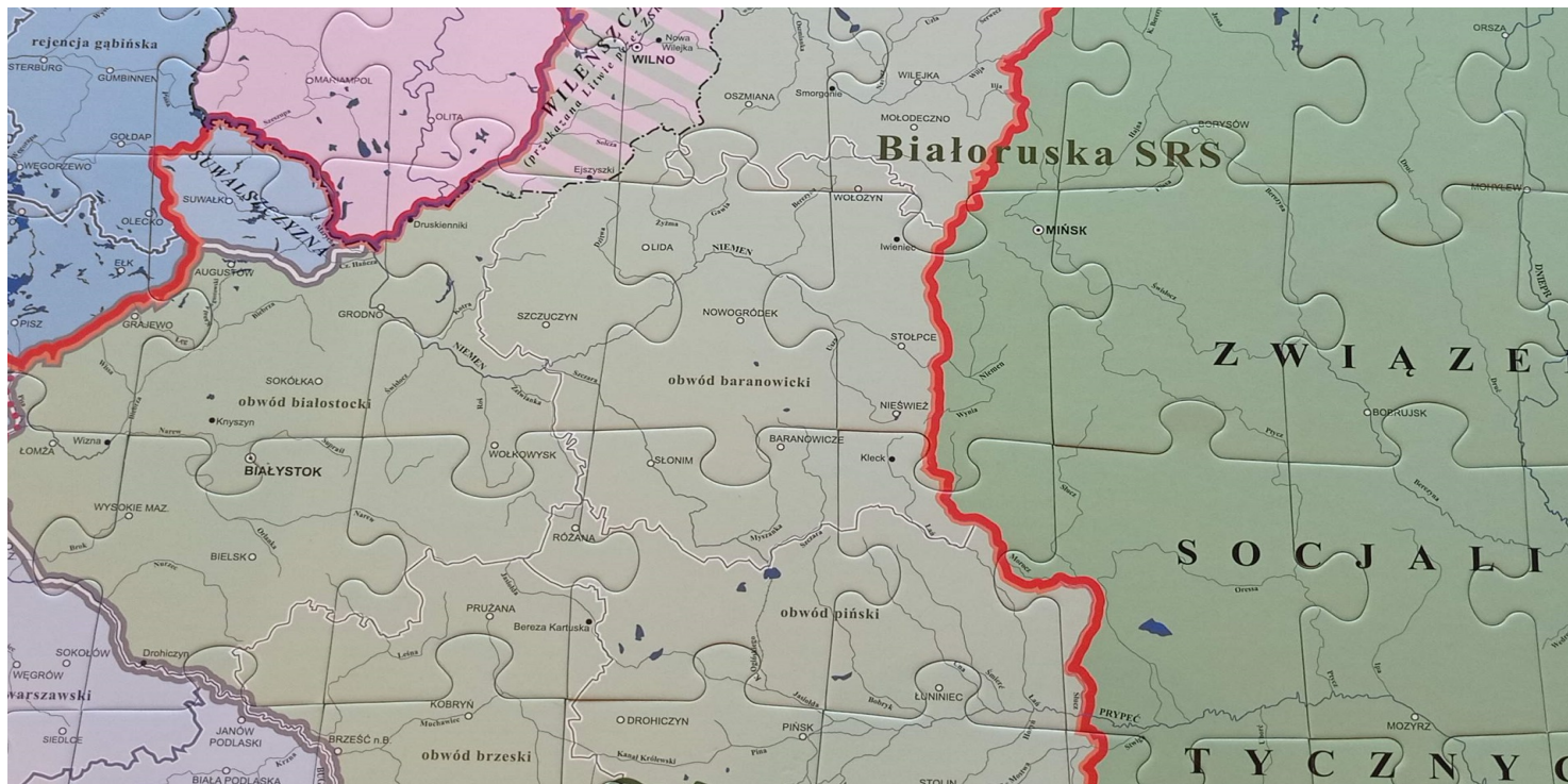
Fragment mapy - puzzle edukacyjne „IV rozbiór Polski”, okupowane ziemie II RP, stan z końca 1939 r. (wyd. IPN, 2016)

https://przystanekhistoria.pl/pa2/teksty/126053,Atak-na-Iwieniec.html