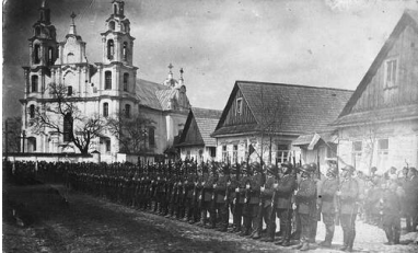
Wojsko Polskie przed kościołem św. Michała Archanioła w Iwieńcu, 1930 r.

W 1886 r. w Iwieńcu działały dwie szkoły żydowskie, przytułek, 17 warsztatów garncarskich, młyn, karczma, 35 prywatnych sklepów. W pobliżu zlokalizowane były: browar, gorzelnia i fabryka wapna 2 . W późniejszych latach w Iwieńcu znajdowały się również koszary otaczające Dom Żołnierza. W czasie okupacji niemieckiej ulokowano tam niemiecki garnizon składający się z: załogi żandarmerii polowej i białoruskich policjantów.