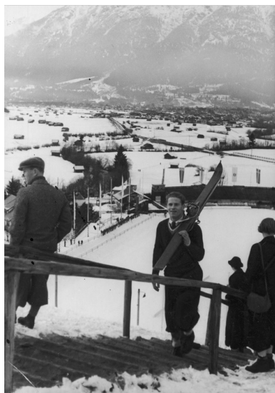
Stanisław Marusarz w drodze na rozbieg na skoczni narciarskiej w

W 1929 r. Stanisław Marusarz wstąpił do Sekcji Narciarskiej Polskiego Towarzystwa Tatrzańskiego (SNPTT) w Zakopanem. Przełomowym w jego karierze był rok 1931, gdyż zdobył wówczas pierwszy tytuł mistrza Polski – łącznie wywalczył dwadzieścia jeden wspomnianych wyróżnień w skokach, zjeździe, kombinacji klasycznej i alpejskiej oraz sztafetach biegowych. Rok później, w 1932, wystartował w igrzyskach olimpijskich w Lake Placid, podczas których, mimo złych warunków technicznych na skoczni, uplasował się na 17. miejscu.